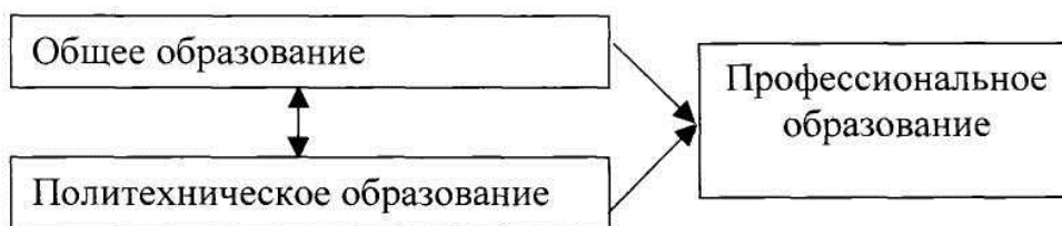
Рис. 1. Взаимосвязь общего, политехнического и профессионального образования

Значительный вклад в развитие теории и практики профессионального образования внес экономист и пролетарский поэт А. К. Гастев, который очертил контуры «индустриальной педагогики» нового типа. Будучи директором Центрального института труда (ЦИТ), он со своими сотрудниками на основе экспериментов создал теорию «Трудовых установок» и разработал концепцию краткосрочной подготовки рабочих на установочных курсах и в цехах ЦИТа, которую широко внедрил в производство, противопоставив ее долгосрочным формам подготовки рабочих в школе фабрично-заводского ученичества (ФЗУ).