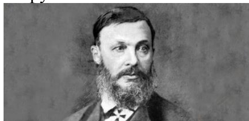
Н. И. Ильминский

Такой выдающейся и разносторонней личностью вошел в историю отечественного образования Николай Иванович Ильминский, российский патриот, просветитель и ученый. Главная его заслуга заключалась в том, что предложенная им система просвещения «инородцев», получившая его имя, объединила разрозненные усилия вышеназванных и многих других национальных педагогов, и это позволило перейти к достаточно широкому, – насколько это было возможно в тогдашних условиях, – внедрению школьного обучения нерусского населения.