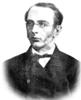
К. П. Победоносцев

При этом первой задачей школы он считал воспитание в духе преданности престолу, православной церкви и приверженности «родным корням», что полностью соответствовало известной формуле, высказанной министром народного просвещения графом С. С. Уваровым («самодержавие, православие, народность») еще в 1840-х гг.