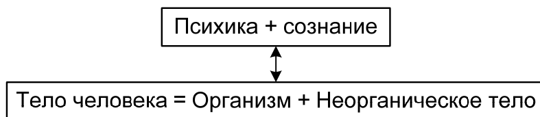
Рис. 1. Структура тела общественного человека

ского тела. Сознание появляется как технологически необходимый регулятивный фактор, который направляет функционирование неорганического тела. Это тело может функционировать при условии, если оно представлено в сознании системой значений (рис. 1):